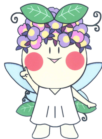
開設20周年記念 キャラクター『フジミン』